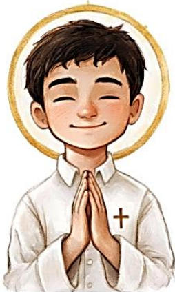
Saint Pier Giorgio Frassati

傅喬治(Pier Giorgio Frassati)是一位虔誠的青年，也是一名傑出運動員和登山者，在同輩中極受歡迎。高中畢業後，他經常參與不同天主教青年團體和聖母軍，以幫助窮人。1922 年加入道明會第三會，並將財富施予窮人，且探訪病人；可是他在福傳時染上疾病而逝世。